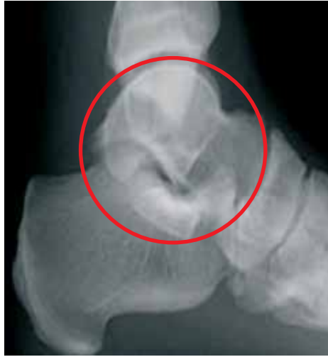
Die M3-Versorgung: Die fachgerechte Dämpfung von Vorfuß, Rückfuß und Mittelfußköpfchen wirken sich positiv entlastend auf Sprunggelenke, Knie und Hüfte aus.

Diesem Stress kann mit der neuen M3-Versorgungsphilosophie vorgebeugt werden! Durch Dämpfung des Vor-, des Rückfußes und des empfindlichen Mittelfußköpfchens in Höhe des Außenknöchels kann eine wesentliche Entlastung dieser Beschwerden erzielt werden. Mit atmungsaktiver Textildecke und modernsten Dämpfungsmaterialien erzielen wir ein Höchstmaß an Komfort und somit eine viel höhere Leistungsfähigkeit Ihrer Füße.